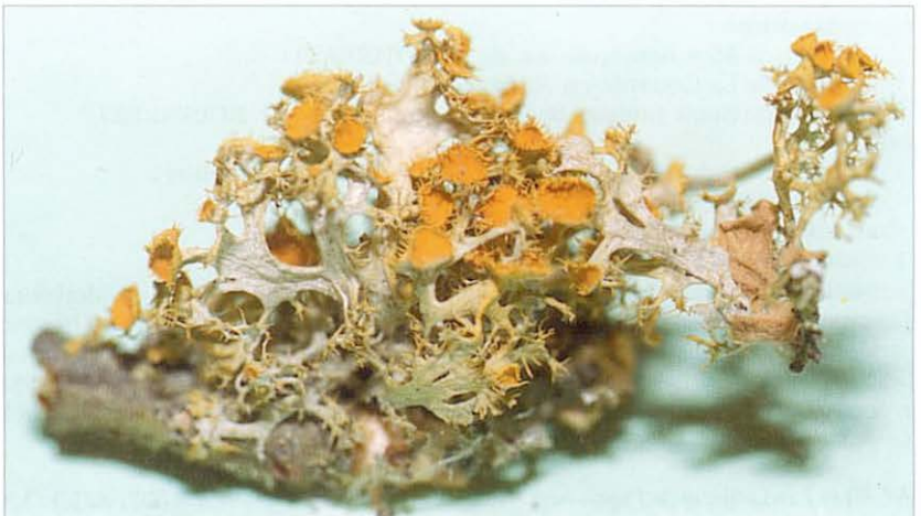
Teloschistes chrysophthalmus Norm. Récolte de Coulgens (Charente). (Photographie Laurent PRÉCIGOUT)

Teloschistes chrysophthalmus est inscrit au projet européen de cartographie des lichens. (Les responsables de 21 pays d'Europe dressent chacun la carte européenne de 2 lichens). La responsable française, Chantal VAN HALUWYN, est chargée de relever 2 lichens : T. chrysophthalmus et Parmotrema arnoldii . Prière de lui transmettre toute observation concernant ces 2 lichens (excepté les indications déjà signalées au Muséum d'Histoire Naturelle) : C.V.H., Faculté de Pharmacie, 59006 Lille.