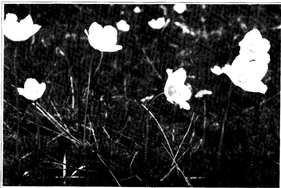
Photo n° 2 : Anemone sylvestris en Laonnois. Le Mont-des-Vaux à Cessières (Aisne).