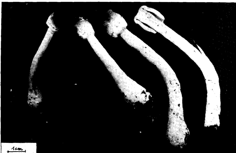
Photographie n° 1 : Des Lépiotes chez les mygales : ces carpophores apparaissant par centaines dans le vivarium ne s'ouvraient pas et ne portaient aucune spore tant que la température restait élevée...