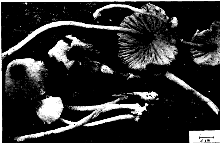
Photographie n° 2 : Un abaissement de la température de 3°C provoquait l'ouverture et la sporulation des carpophores : il s'agissait de Leucocoprinus brebissonii (God.) Locq.