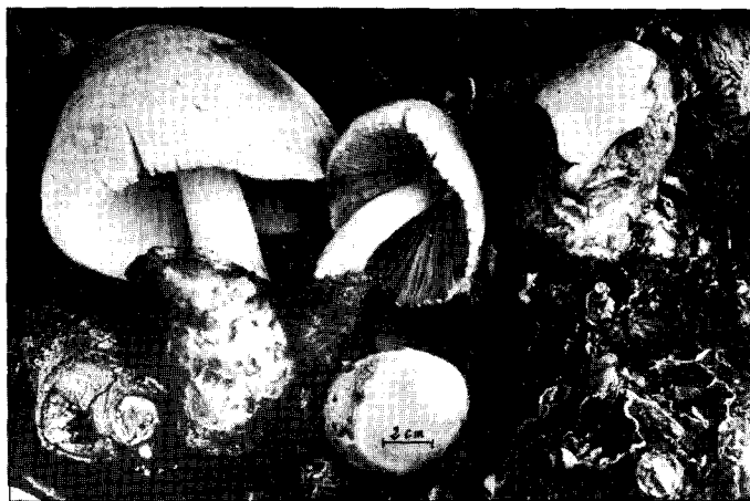
Photo n° 1 : Volvariella bombycina (Sch. : Fr.) var flaviceps (Murr.) Schaffer : une magnifique forme, au chapeau orné de fines fibrilles soyeuses comme le type, mais entièrement jaune d'or. (Les photographies illustrant cet article sont de G. FOURRÉ : reproductions de diapositives).