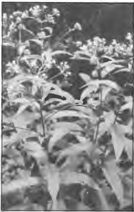
Senecio cacaliaster.