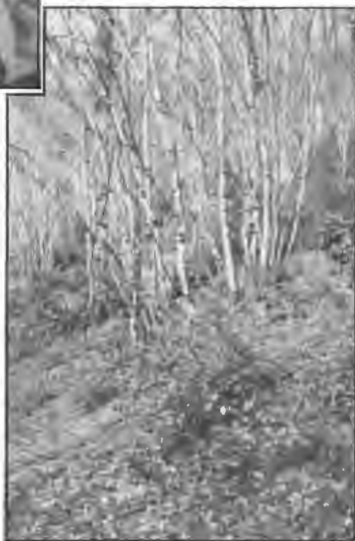
Le taillis de charmes et de houx, au mois de mars.