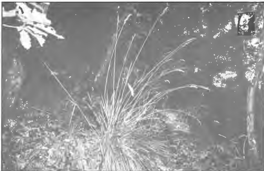
Festuca paniculata ssp. spadicea.