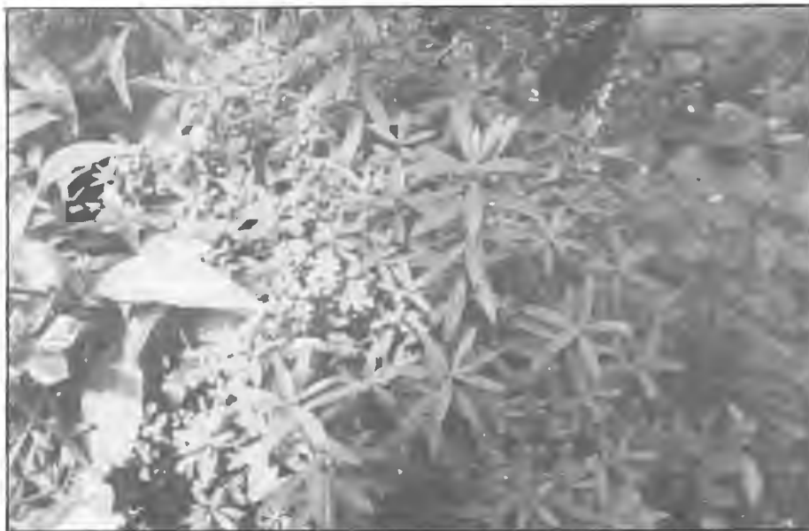
Euphorbia villosa.