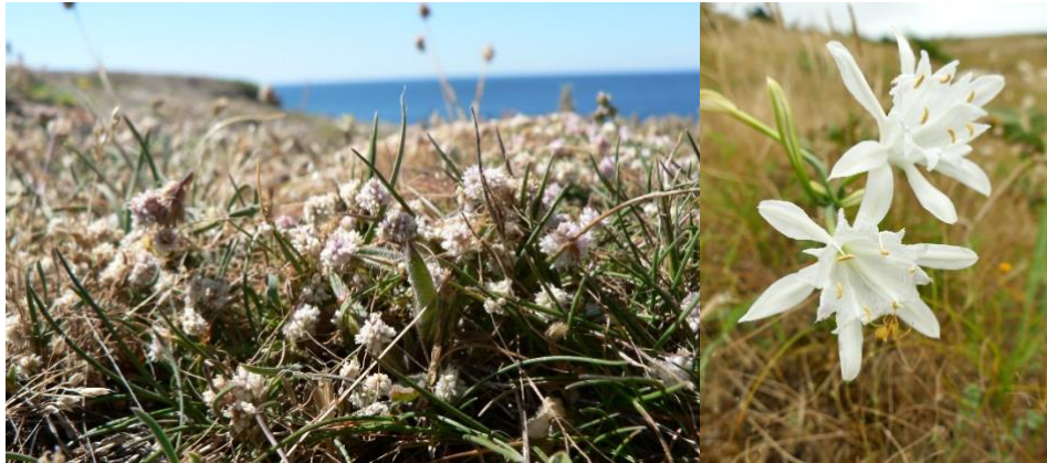
Figure 6. Cuscuta planiflora subsp. godroni - Pancratium maritimum

31 mai 2025 : Dunes d'Erdeven et Penthièvre : Achillea maritima , Anacamptis palustris , Asterolinon linum-stellatum , Blackstonia imperfoliata , Linaria arenaria , Liparis loeselii , Ophrys passionis , Parentucella latifolia , Teucrium scordium subsp. scordioides , Spiranthes aestivalis , Omphalodes littoralis , Juncus maritimus , Epipactis palustris , Sagina nodosa , Schoenus nigrescens , Juncus subnodulosus , Cladium mariscus , Lysimachia tenella , Euphrasia tetraquetra