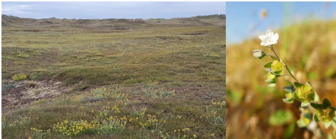
Figure 7. Dunes d'Erdeven / Omphalodes littoralis

31 mai 2025 : Dunes d'Erdeven et Penthièvre : Achillea maritima , Anacamptis palustris , Asterolinon linum-stellatum , Blackstonia imperfoliata , Linaria arenaria , Liparis loeselii , Ophrys passionis , Parentucella latifolia , Teucrium scordium subsp. scordioides , Spiranthes aestivalis , Omphalodes littoralis , Juncus maritimus , Epipactis palustris , Sagina nodosa , Schoenus nigrescens , Juncus subnodulosus , Cladium mariscus , Lysimachia tenella , Euphrasia tetraquetra