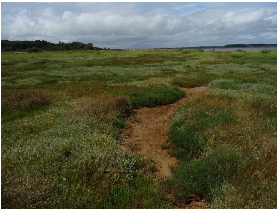
Figure 4. Marais de Branzais à Pénestin

30 mai 2025. Belle île (bateau + vélo) – Pointe des Poulains, Port de Stêr Vraz, Port de Donnant, Port Coton : Adiantum capillus-veneris , Asparagus officinalis subsp. prostratus , Asphodelus arrondeaui , Aster lynosyris var. armoricanus , Bellardia trixago , Centaureum maritimum , Crambe maritima , Crataegus monogyna subsp. maritima , Cuscuta planiflora subsp. godroni , Erodium malachoides , Erodium botrys , Festuca huonii , Genista tinctoria subsp. littoralis , Gladiolus gallaecicus , Isoetes histrix , Kickxia commutata , Limonium ovalifolium , Linaria arenaria , Linaria pelliseriana , Ophioglossum lusitanicum , Pancreatium maritimum , Polygonum maritimum , Ranunculus ophioglossifolius , Serapias parviflora , Tolpis umbellata , Torilis nodosa subsp. webbii .