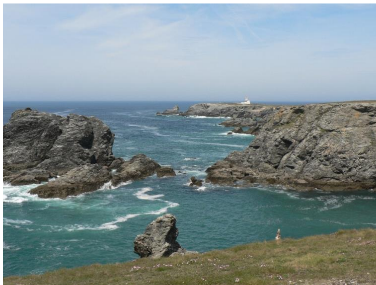
Figure 5. Pointe des Poulains sur Belle-Ile

Carte de la végétation de Belle-Ile (d'après un original inédit de R. Corillion). En 1987, lors du premier colloque sur les plantes menacées de France qui s'était déroulé au Conservatoire Botanique National de Brest, Robert Corillion avait généreusement proposé à F. Bioret de lui faire don d'une carte en couleurs inédite de la végétation de Belle-Ile, réalisée en 1971 à l'occasion de la session de la Société Botanique de France en Bretagne. Trente années plus tard, cette carte demeure d'actualité pour montrer la répartition générale des principales formations végétales sur la côte "en dehors" au vent, et sur la côte "en dedans" sous le vent.