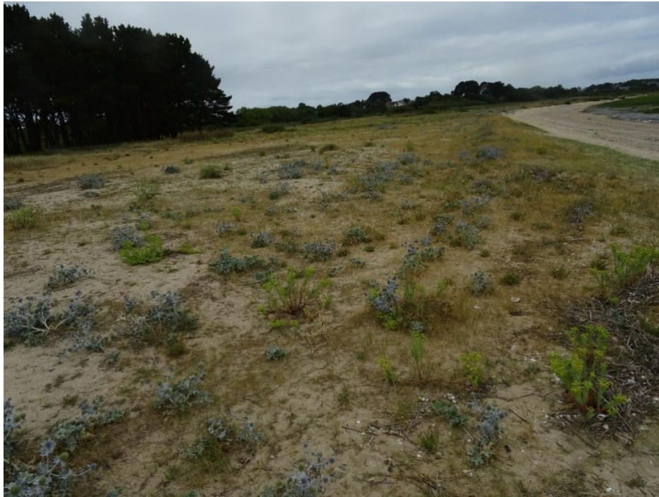
Figure 3. Dunes de Ménard à Pénestin