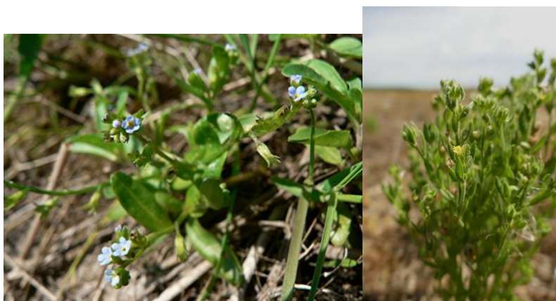
Figure 2. Myosotis sicula – Linaria arenaria – © F. Le Bloch

Parking : Aire de repos de Tréhiguier Pénestin