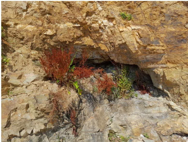
Figure 1. Rumex rupestris dans les falaises de Billiers

28 mai 2025. Falaise de Billiers (RDV Parking de la Plage des Granges), Dolmen du Crapaud puis Marais de la pointe du Moustoir (petit parking du Moustoir) : Berula erecta , Luronium natans , Myosotis sicula , Ranunculus tripartitus , Rumex rupestris , Trifolium bocconeii , Trifolium medium , Trifolium strictum , Paspalum distichum , Juncus gerardii , Polypogon monspeliensis , Triglochin maritimum , Lotus glaber , Parapholis incurva , Sueda maritima et vera , Bupleurum tenuissimum , Carthamus lanatus , Trifolium resupinatum , Hordeum marinum , Centaurium tenuiflorum , Pilosella peleteriana , Parentucellia viscosa