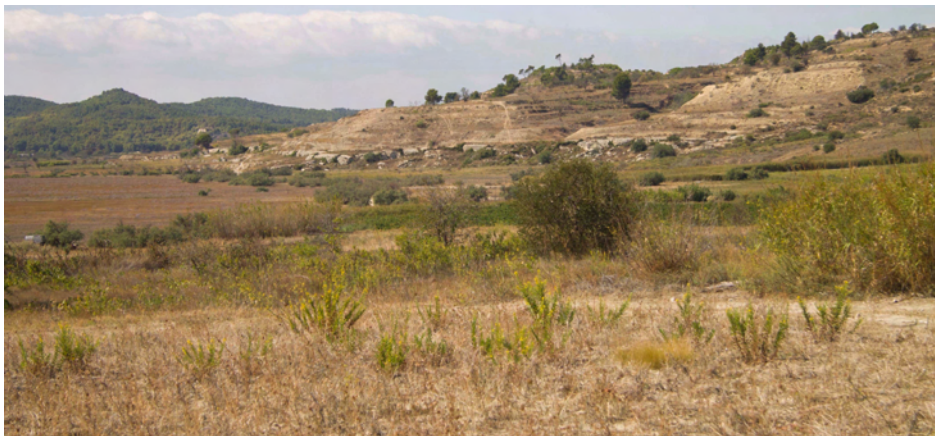
Coteaux marneux de Lespignan-Nissan

Siège social de la Société Botanique du Centre-Ouest: Nercillac - BP 80098 - F - 16200 - JARNAC Tél. : 05 45 82 58 43 president@sbco.fr - tresorier@sbco.fr - secrtaire@sbco.fr - Site : http://www.sbco.fr