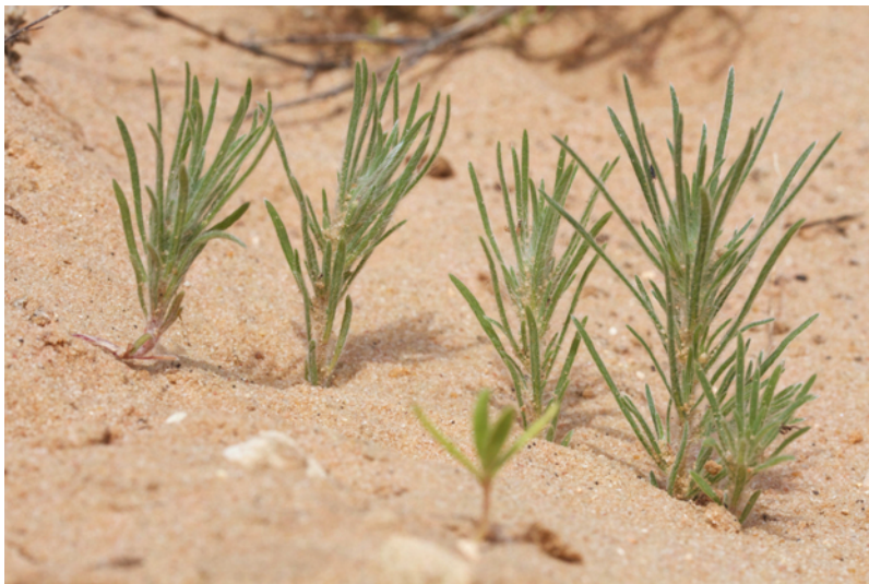
Bassia laniflora , photographiée en mai 2016 dans les sables de Mormoiron

Programme : flore automnale, notamment celle des sables de Mormoiron à Bassia laniflora !