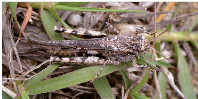
Photo 1 - Acrotylus braudi , endémique corse.