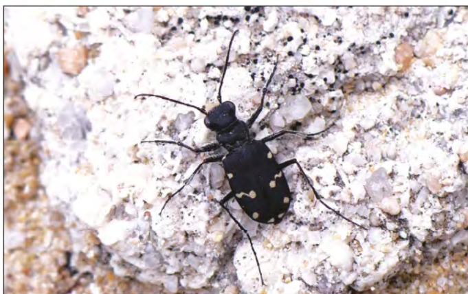
Photo 5 - Cicindela campestris subsp. corsicana .