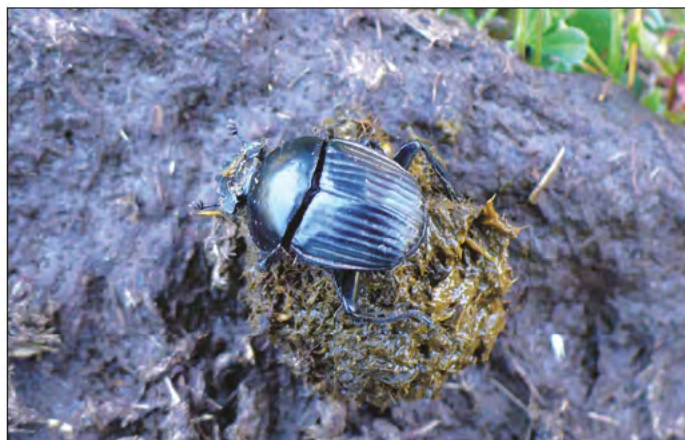
Photo 6 - Scarabaeus (Ateu- chetus) laticollis . (Photo Claudine FORTUNE).