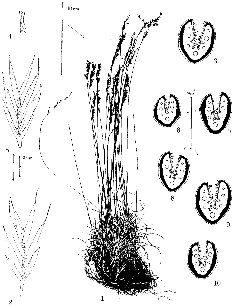
Planche 1. Festuca fabrei Kerguelen & Plonka.

Fig. 1, 2, 3, 4, Cirque de Mourèze (Hérault), 19 juin 1987. 1. plante entière, 2. épillet, 3. section de limbe d'innovation, 4. anthère ; 6-10. sections foliaires de divers individus de la même population.