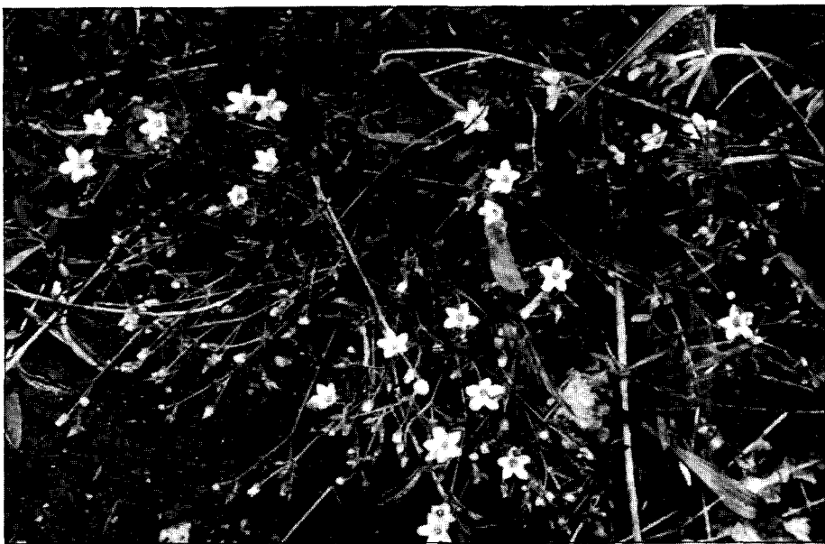
Arenaria controversa .