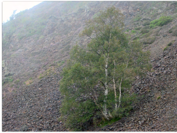
Le bouleau stoïque dans le brouillard, bien solidement ancré sur son pierrier, symbole de pugnacité.

L'automne de la nature n'est que dormance et en cela diffère de celui de la vie de l'homme... Mais Rémy et moi tenons à profiter le plus longtemps possible du bel été charentais (précurseur de l'été indien), en partie pour les beaux yeux de la SBCO. [Y. P.]